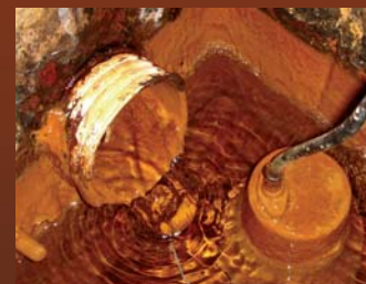
Dépôt de boue gluante de couleur ocre dans le bassin de captation des eaux pluviales